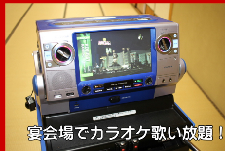
宴会場でカラオケ歌い放題！