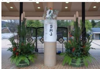
正面ゲート(昨年写真)